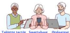
Tablette tactile Smartphone Ordinateur

N'attendez plus, prenez rendez-vous gratuitement dans votre commune !